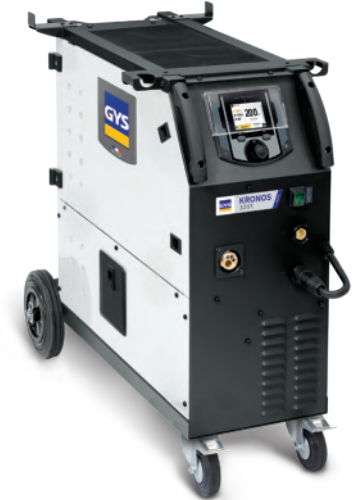
Wird ohne Zubehör geliefert