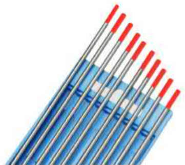
= ca. 2 % Thoriumoxid

n067.0.0201 n067.0.0202 n067.0.0203 n067.0.0204 n067.0.0206 n067.0.0207 n067.0.0208