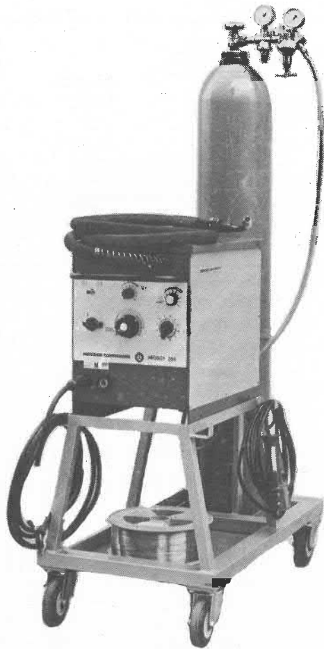
Bild 1 MIGBOY 200 mit Werkstattwagen