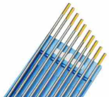
= ca. 1,5 % Lanthanoxid

n067.0.0701 n067.0.0702 n067.0.0703 n067.0.0704 n067.0.0706 n067.0.0707 n067.0.0708